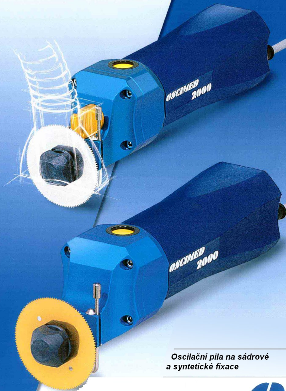
Oscilační pila na sádrové a syntetické fixace